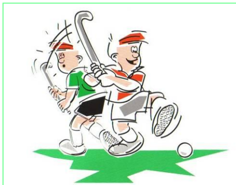
Gevaarlijk zwaaien met de stick