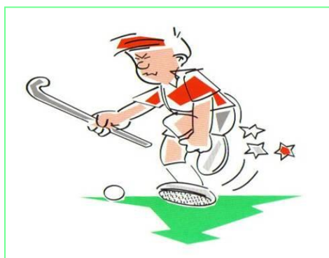
De bal met de voet spelen