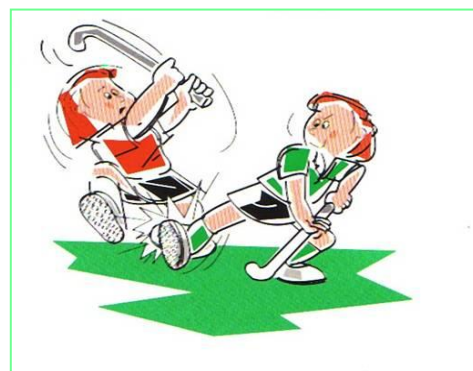
De tegenstander duwen